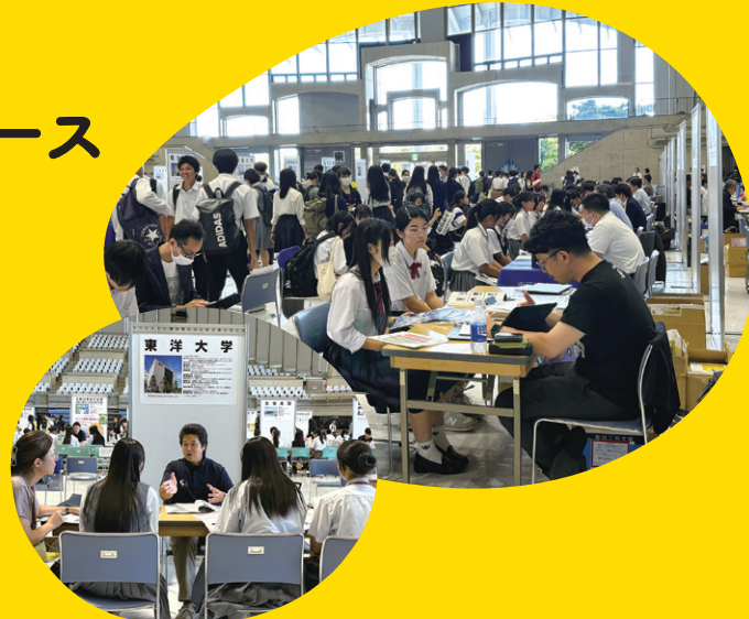
※写真は2024年実施風景です。また、参加大学・参加内容につきましては、変更の可能性もございます。